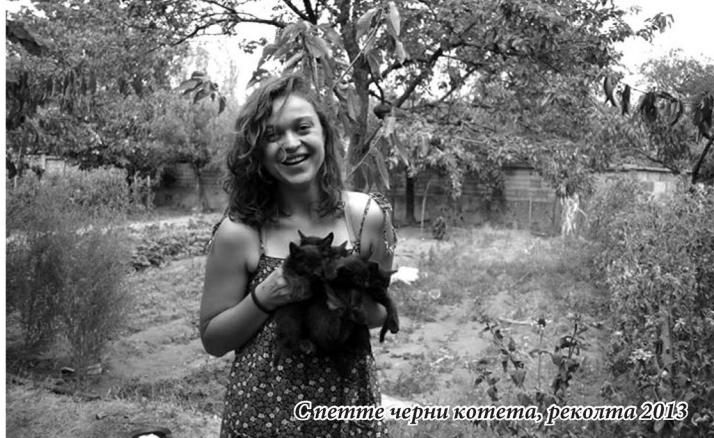
Светлите черни котета, реколта 2013

Откроява се от мнозинството с онова шарено намигане в дрехите, заблещукало на деня в артистично замотания шал на фигурки или в изчанчените арт обеци. Или в смелото съчетание на синьо с трева и ей-така навъртените дрънкулки. Може да я разпознаете и по косите: в тях винаги има вятър и слънце.