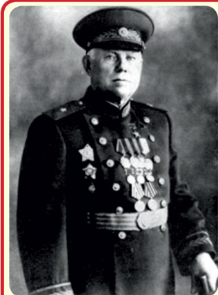
Животът на Василий Дегтяров сам по себе си е подвиг. Във времето на неговите гениални разработки в света не е имало друг конструктор, с когото може да бъде сравняван. Създаденото от него оръжие е изключително: пехотната картенцица ДП, авиационната и танковата картенцица ДТ, картенцият пистолет ППД, противотанковата пушка ПТРД, голямокалибрена картенцица ДШК. Той е първият руски конструктор, на когото е присъдено званието Герой на социалистическия труд – през 1940 г., когато става и доктор на техническите науки. Четири пъти е Лауреат на Държавна премия, носител е на три ордена „Ленин“, на ордени „Суворов“ I и II ст., „Червено знаме на труда“, „Червена звезда“, на много медали.

ния образец. Комисията отчела оригиналността на идеята, безотказността на работа, скоростта и опростената система. След това възложили на Фьодоров и Дегтяров да създадат за Червената армия безкрайно необходимата лека, здрава и надеждна картенцица. Всеки детайл Дегтяров правел със