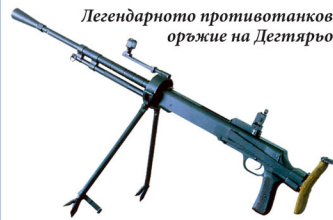
Легендарното противотанково оръжие на Дегтяров

Противотанковото оръжие ПТРД. Създаването, усвояването и пускането в производство на противотанковото оръжие на Дегтяров е една от славните страници в живота на големия конструктор. То трябвало да бъде такава, че противникът, „опакован“ в танкова броня, да може да бъде спрян. Противотанковото 14,5 мм еднозарядно оръжие ПТРД е създадено само за три месе-